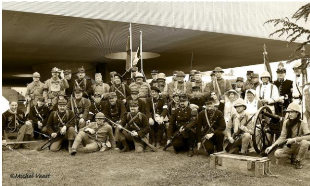
"L'histoire vivante" devant le Musée de la Grande Guerre de Meaux

En partenariat avec la Société des Amis du Musée de la Grande Guerre (SAM2G) et suite au succès de la 1 e édition, le musée de Meaux a invité à nouveau les associations d'histoire vivante le temps d'un week-end qui leur a été dédié pour un moment de rencontre, de découverte et de partage de connaissances. Le public a pu échanger avec ces passionnés qui mènent la même mission que le musée : rendre l'histoire vivante et accessible à tous.