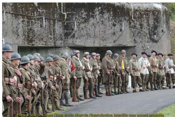
Photo Frédéric Coune / Tous droits réservés / Reproduction interdite sans accord préalable