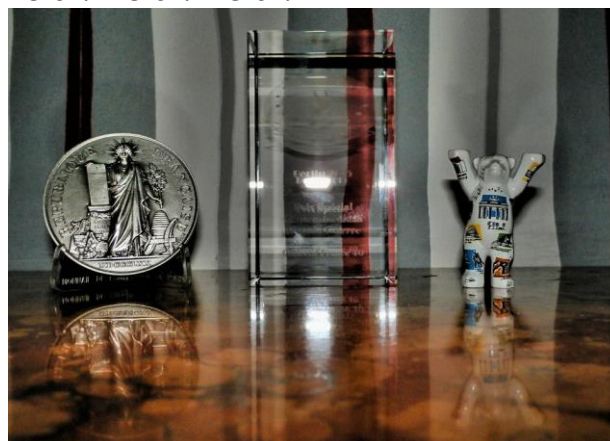
La médaille de la présidence française, le Trophée européen en cristal gravé et l'Ours de Berlin.