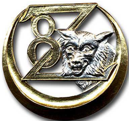
1 er insigne de 1934