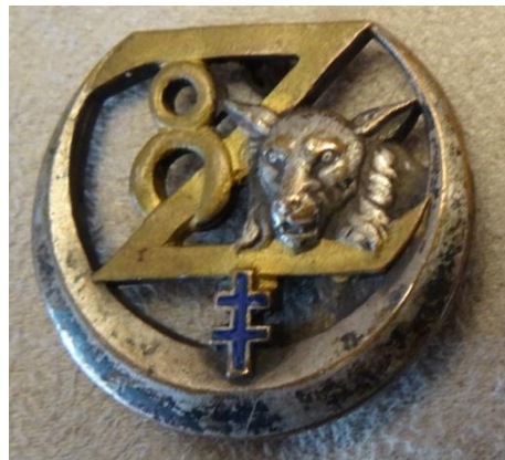
1 er insigne (adjonction de la croix de Lorraine en 1947 ou 1948))