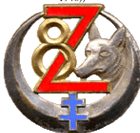
2 e modèle - Insigne période (..... -1962) (variante , tête du chacal de face)