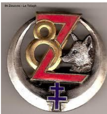
2 e modèle - Insigne période (..... -1962)