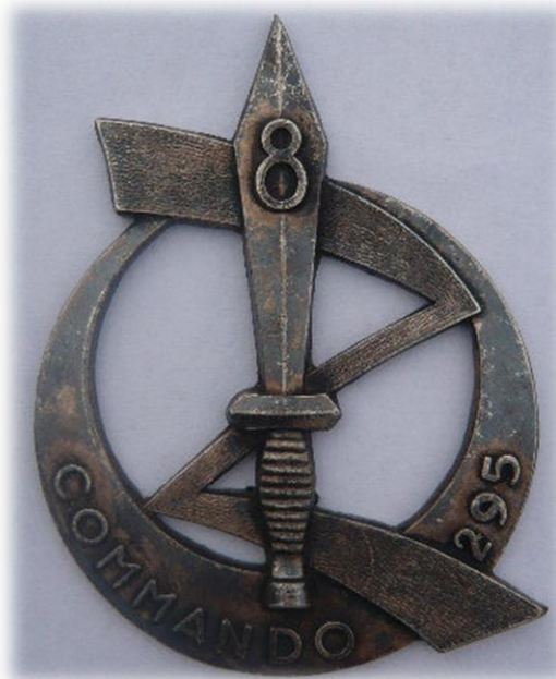
Insigne Commando 295 en Algérie (mars 1962 - variante pointe vers le haut)