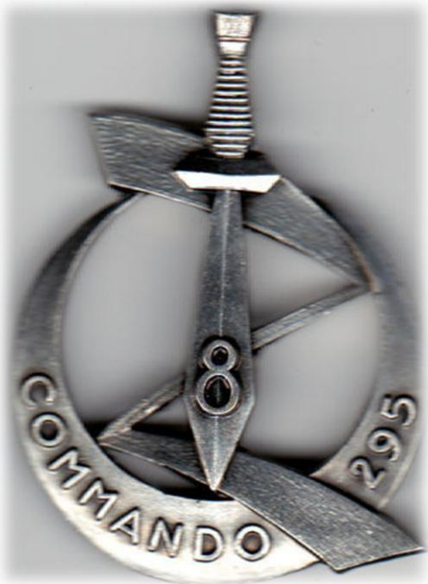
Insigne Commando 295 en Algérie (décembre 1960)