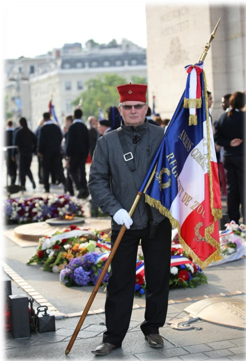
L'emblème de notre Amicale sous l'Arc de Triomphe

8 juin : Cérémonie en l'honneur de la guerre d'Indochine : Rallumage de la flamme à l'Arc de Triomphe.