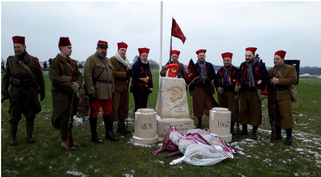
Les acteurs de l'histoire vivante perpétuent le souvenir des Zouaves.

C'est ici que les Zouaves ont choisi en 2013 d'édifier leur mémorial national, ici à une portée de fusil de la Butte des Zouaves, que nous venons honorer nos anciens tous les ans depuis 1920, ici au cœur de la Picardie, vieille terre d'histoire où les Zouaves ont si souvent combattu et où des milliers d'entre eux ont laissé la vie.