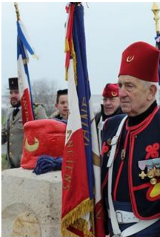
Toutes générations confondues pour les porte-drapeaux !