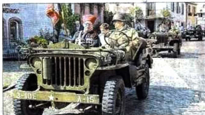
À la fin de la cérémonie, les anciens Zouaves sont repartis dans les Jeep de l'association United States Alsace memory US vers la salle Hirtenhaus.

L'amicale, créée en 1971, continue tous les premiers week-ends de septembre à perpétuer la mémoire des Zouaves dans une ville du Grand Est.