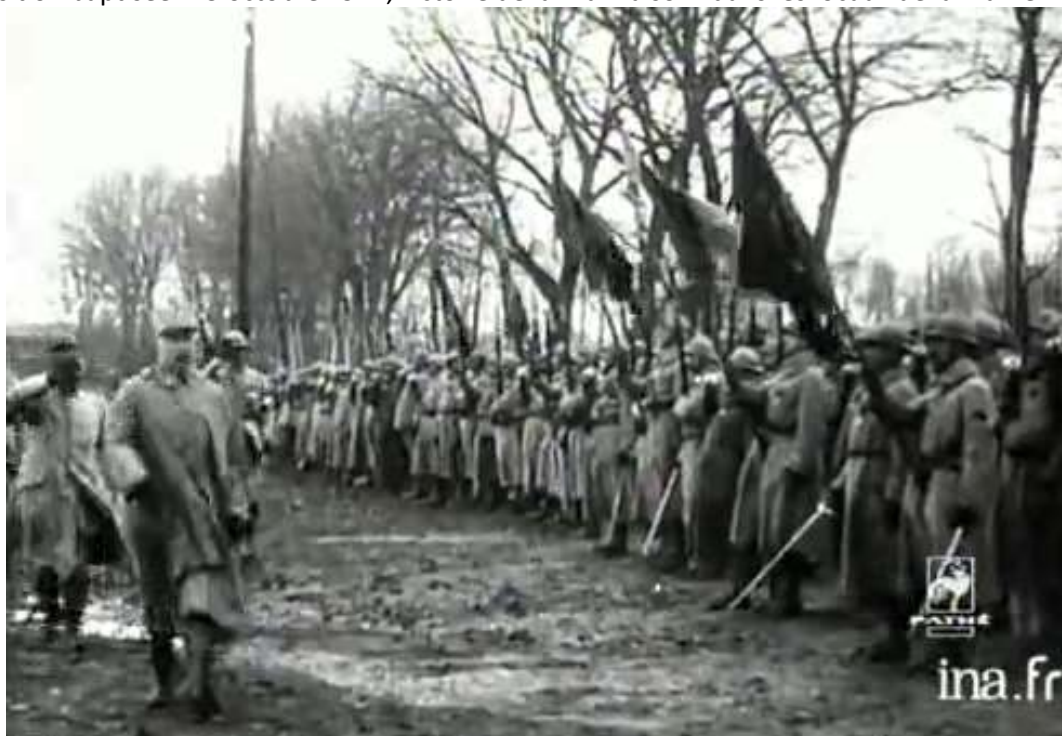
Le Maréchal Pétain passe en revue les régiments victorieux avant de les décorer.

Les canons, les chars et l'aviation ont été déterminants dans cette victoire : le camp de reconstitution installée pour les commémorations sera l'occasion d'assister à de nombreuses démonstrations de matériels militaires de l'époque. Parallèlement, l'association de Chavignon "Culture et Histoire autour du Vignon" propose du 22 au 29 octobre une grande exposition baptisée "23 octobre 1917, victoire de la Malmaison" dans les locaux de la mairie.