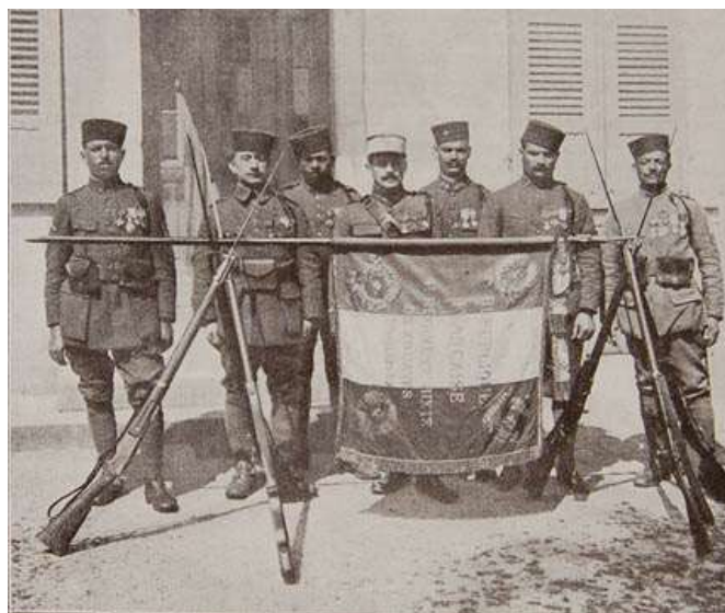
Le drapeau du 4 e régiment mixte de zouaves et tirailleurs.

Essentiellement composé de tirailleurs, il reçoit le 6 ème bataillon du 4 ème régiment de zouaves en juin 1915, il combattra pendant pratiquement toute la guerre au sein de la 4e brigade du Maroc.