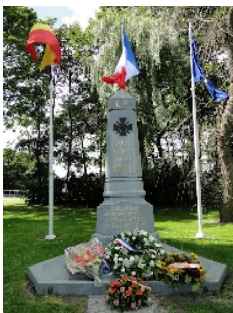
Monument Français de la 81 ème D.I.T.