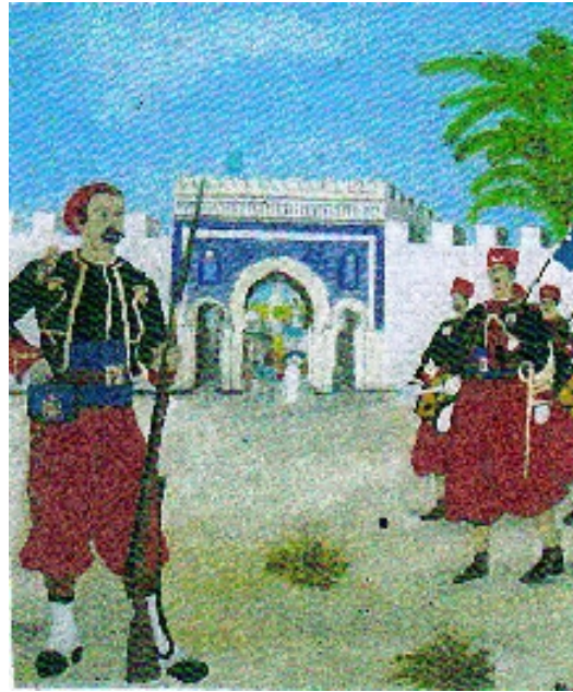
Peinture à l'huile réalisée par notre porte-drapeau Salvador HUBY

Un artiste peint sur ardoise nos braves Zouaves, si cela vous intéresse contactez le :