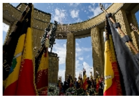
Le monument dédié à S.M. le Roi ALBERT 1 er et aux héros de l'Yser