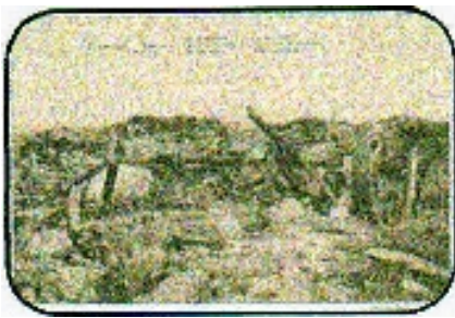
La minoterie en 1918