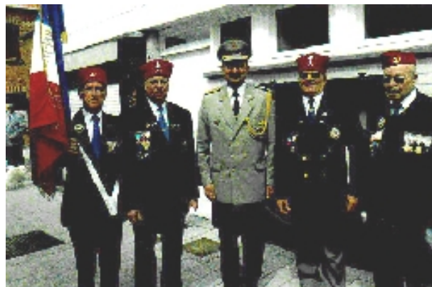
Le Colonel ZILKA avec nos Zouaves

L'accueil fut très chaleureux à l'image du colonel slovaque Ivan ZILKA attaché de défense à Paris.