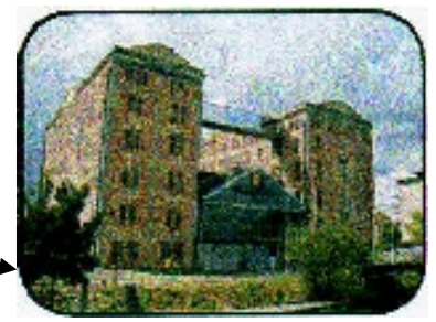
Le Westoria en 2012

Harmonie de la Ville de Dixmude en tête, suivie d'un détachement de la Batterie Antiaérienne du Bataillon Artillerie (Armée belge), des drapeaux des associations patriotiques parmi lesquels Serge avec son escorte, le cortège se met en branle vers le Square des Italiens où se déroulera un hommage aux Canadiens qui libérèrent la ville en septembre 1944 et aux prisonniers politiques de 40-45.