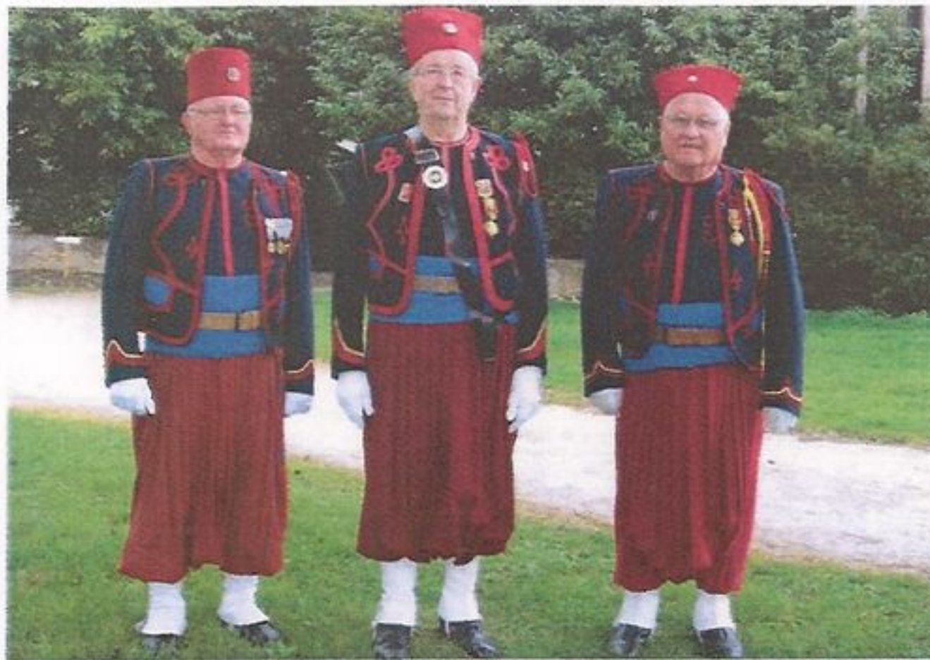
Château des Granges.