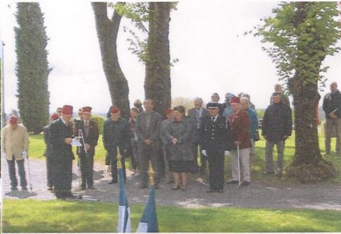
Assemblée Générale Saint-Eugène