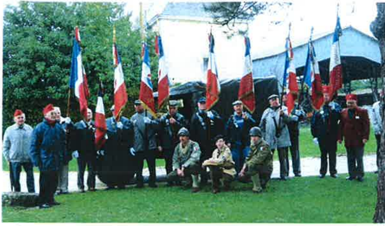
Château des Granges