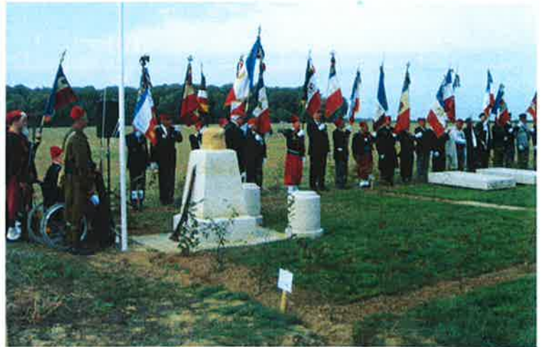
"Jardin de Mémoire"