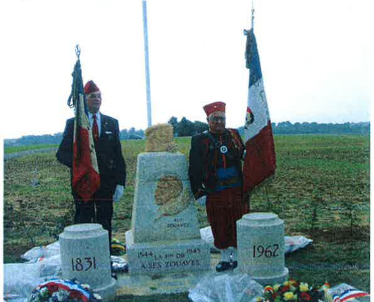
"Jardin de Mémoire"