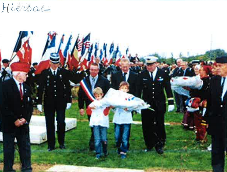
"Jardin de Mémoire"